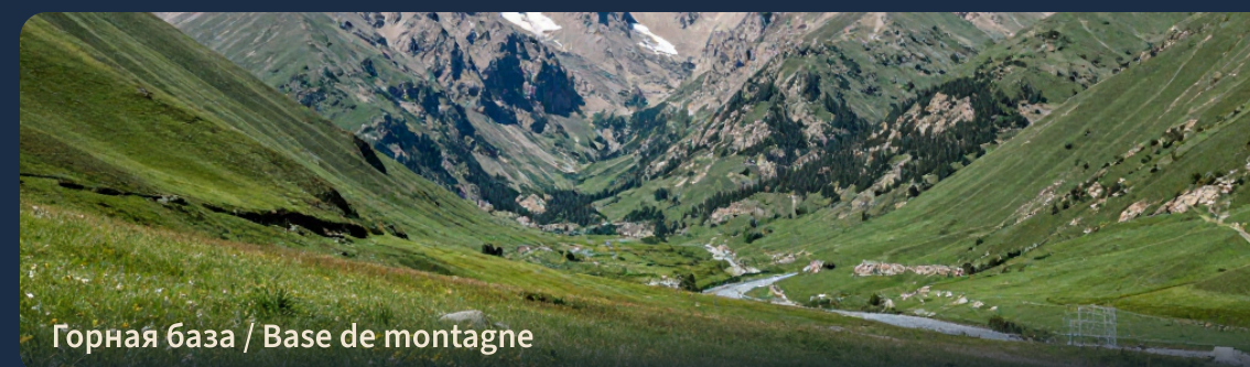
Горная база / Base de montagne